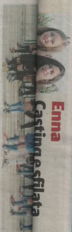
Un incontro nel campo sportivo di Barrafranca