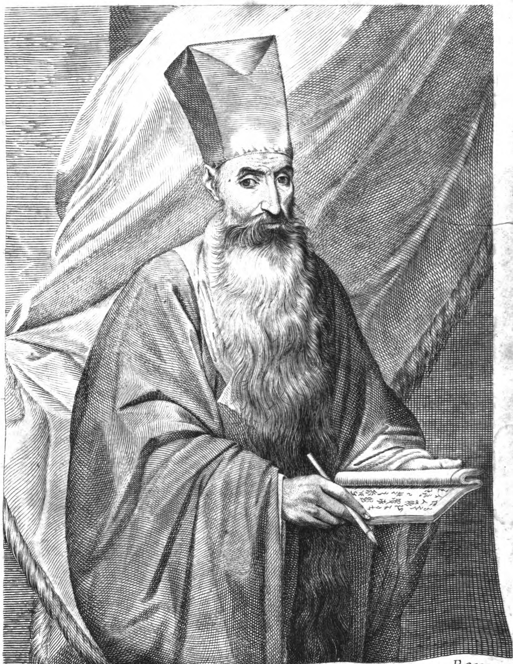
P. Alvaro Semedo Portoghese, della Comp. a di Giesu, Venuto a Roma Procurator delle Prou. e del Giapone et della China, nell'an. 1642.