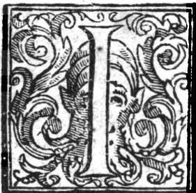
Forma del Te- stamento del Rì

O da fanciullo presi il gouerno di questa Monarchia per mano de' miei Maggiori, e l'hò tenuto per anni 48. tempo assai lungo: onde non hò ragione di lamentarmi perche hora l'hò à lasciare. Subito che io fui creato Imperatore, mi disposi di voler gouernar bene, & imitar li miei Predecessori, come procurai anche di fare con ogni esattezza. Mà poi impedito da varie infermità per molti anni, lasciai di procurare che si facessero li soliti sacrificij al Cielo & alla Terra: anzi non mi curai manco di far li debiti officij alla memoria de' miei Maggiori. Rarissime volte mi posi nel trono per consultar le cose del Regno: trattenni li Memoriali, che mi furono presentati senza spedirgli. Non mi prestai pensiero di nominare secondo il bisogno li Magistrati del Regno; & hora pure sò che ve ne sono alcuni di meno. Hò aperto nuoue miniere d'oro e d'argento: hò accresciute & moltiplicate le gabelle: hò disturbata la pace publica con tumulto di guerra; onde ne sono seguiti aggrauij de' Popoli, e discordie co' Principi vicini. Pensando ad ogn'hora, di giorno e di notte à queste cose, appena posso soffrire il dolore dell'animo, che detesta tutte le colpe passate, Cominciauò finalmente ad hauere migliori pensieri: ma son caduto in questa infermità, la quale vò sempre tanto crescendo, che mi fà credere d'hauer presto à perder la vita.