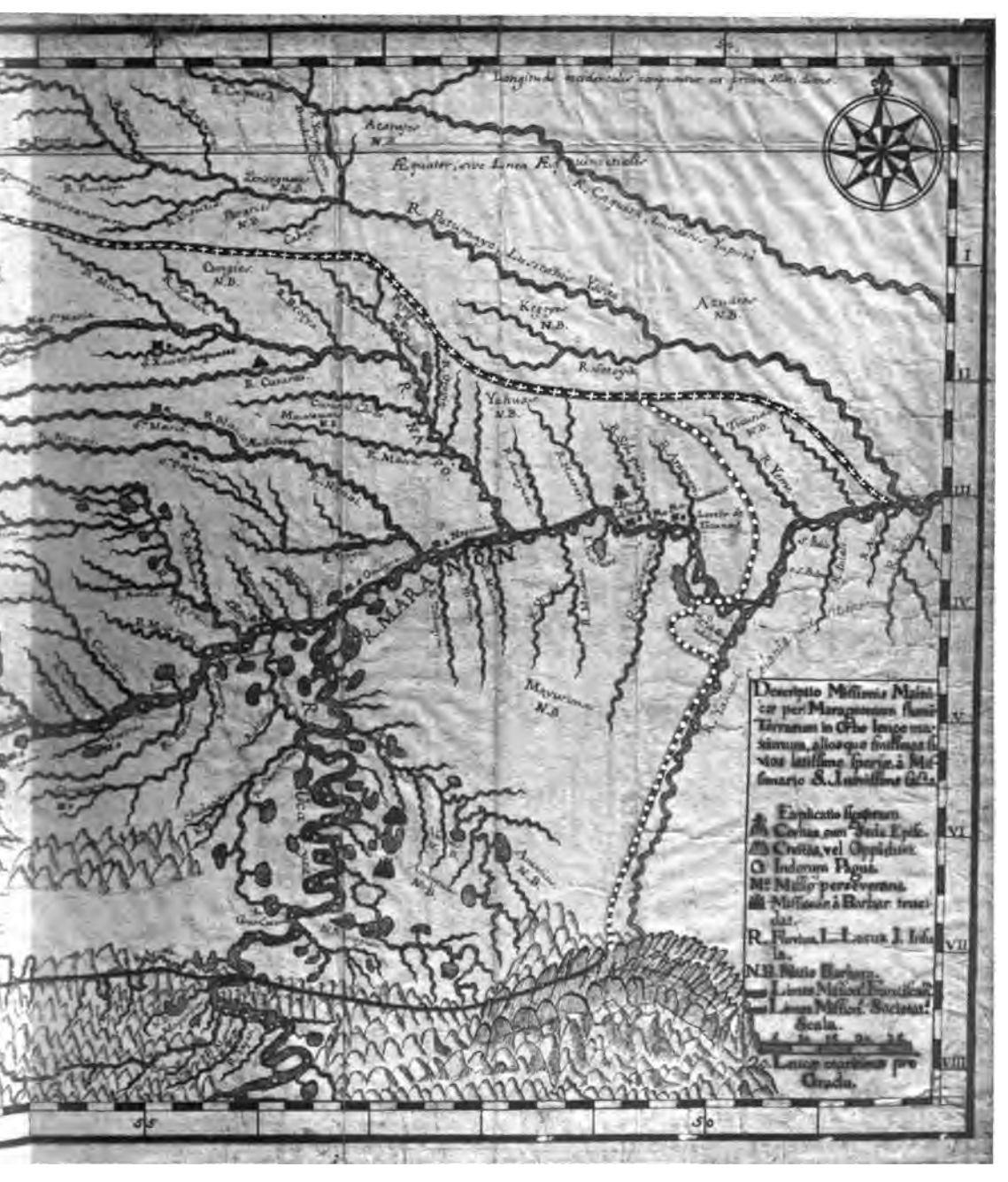
LISBOA POR EL P. FRANCISCO JAVIER WEIGEL